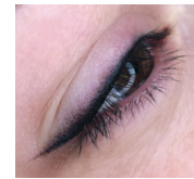
DORA HOLLOS STARDUST EYELINER