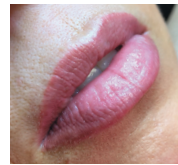
DARLINE VIERSTRAETE AQUAREL LIPS