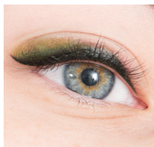
TÜNDE MÉHN BUTTERFLY EYELINER