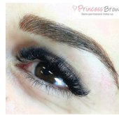
REBECCA CHUNG CELEB BROWS